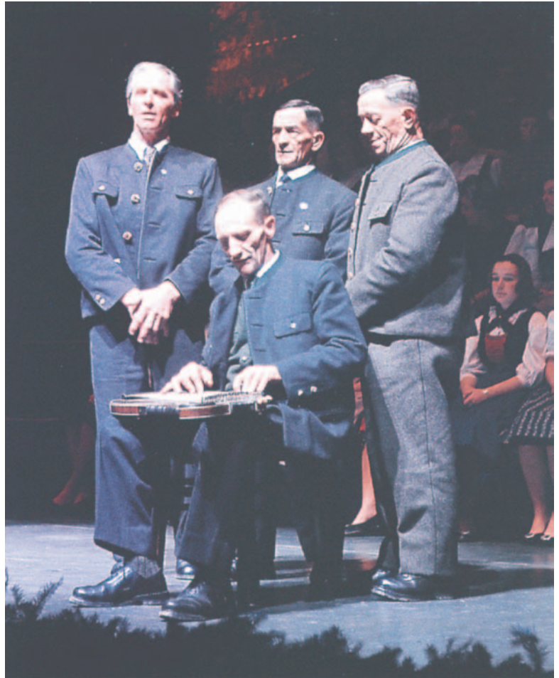
Die Riederinger Sänger beim Salzburger Adventsingen Anfang der 1960er Jahre