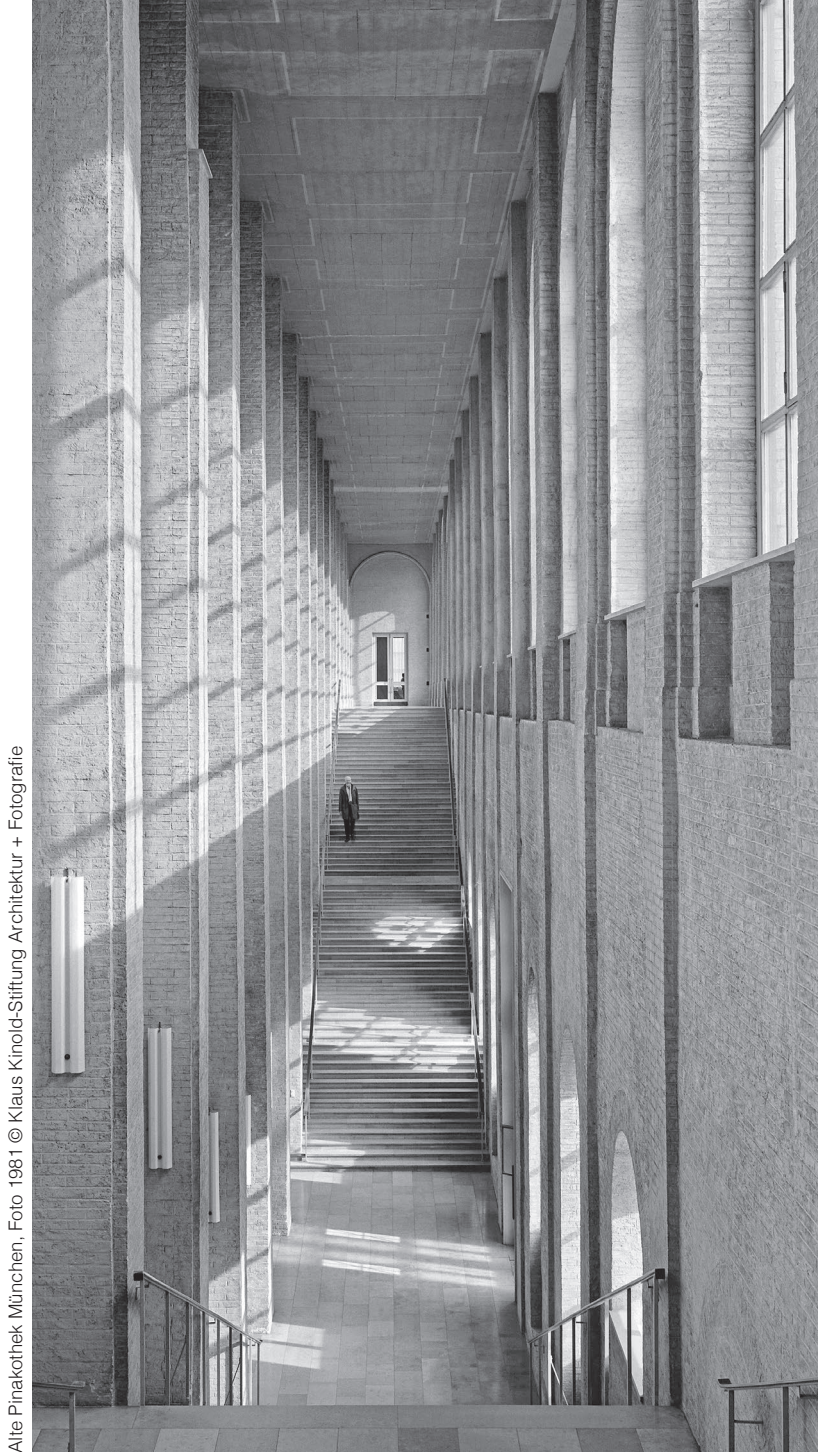
Alte Pinakothek München. Foto 1981 © Klaus Kinold-Stiftung Architektur + Fotografie

TUM School of Engineering and Design Technische Universität München Archiv des Architekturmuseums, Dr. Irene Meissner Lehrstuhl für Entwerfen und Gestalten, Prof. Uta Graff in Kooperation mit der Bayerischen Akademie der Schönen Künste, Prof. Dr. Winfried Nerdinger